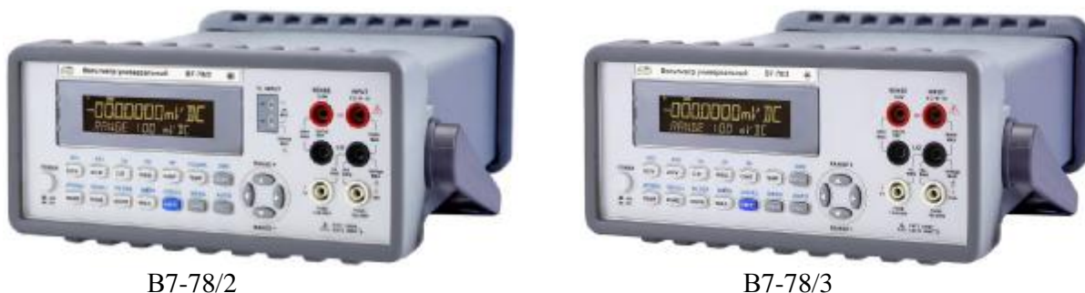
Рисунок 1. Фотографии общего вида вольтметров.